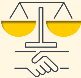
Aseiad o'r Effaith ar Gydraddoldeb

Mae ein hasesiad effaith yn cwmpasu'r canlynol: