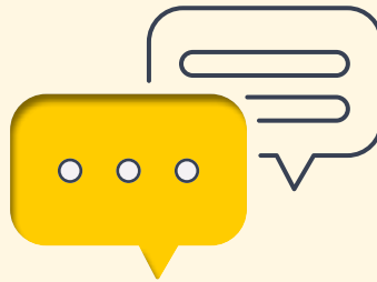
Aseiad o'r Effaith ar y Gymraeg